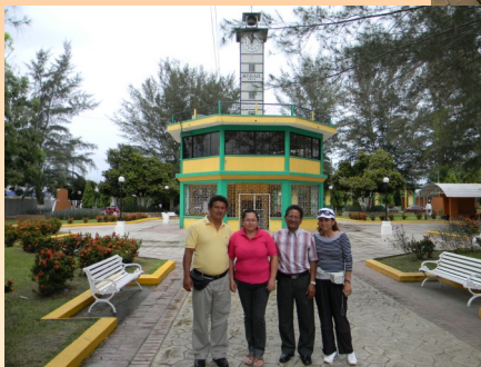
Tiempo de descanso